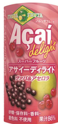
アサイーディライト® グァバ&アセロラ

飲みやすさにこだわったブルーベリーの爽やかな酸味と、アサイーとブルーベリーの“Wポリフェノール”が特長です。